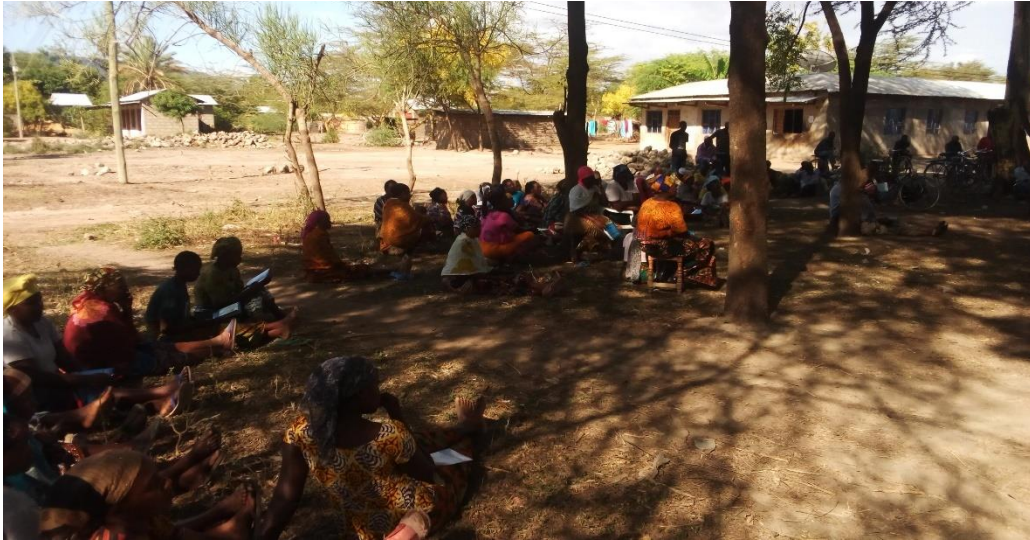
WANAJAMII WA KIJJI CHA MAJENGO WAKIWA KATIKA MCHAKATO WA KUIBUA MIRADI YA JAMII.