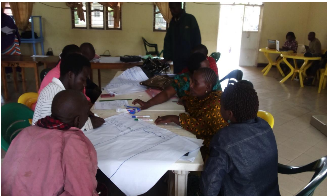
KAMATI ZA KITARAFU ZIKIFANYA KAZI ZA VIKUNDI EG. KUCHORA NADHARIA YA MABADILIKO (THEORIES OF CHANGE) MTO WA MBU.