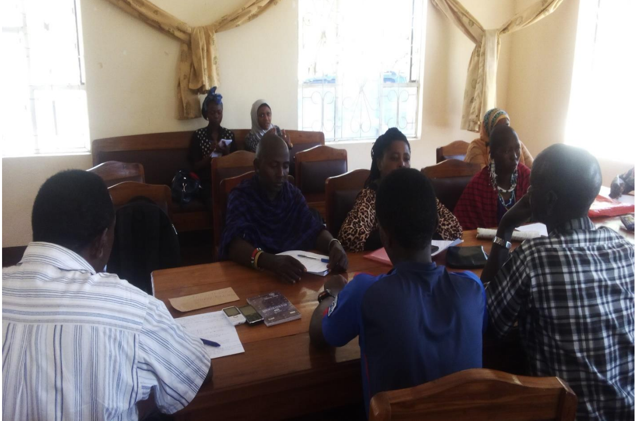
KAMATI YA MRADI MANYARA IKIWA KATIKA MCHAKATO WA KUPITISHA MIRADI YA KITARAFU