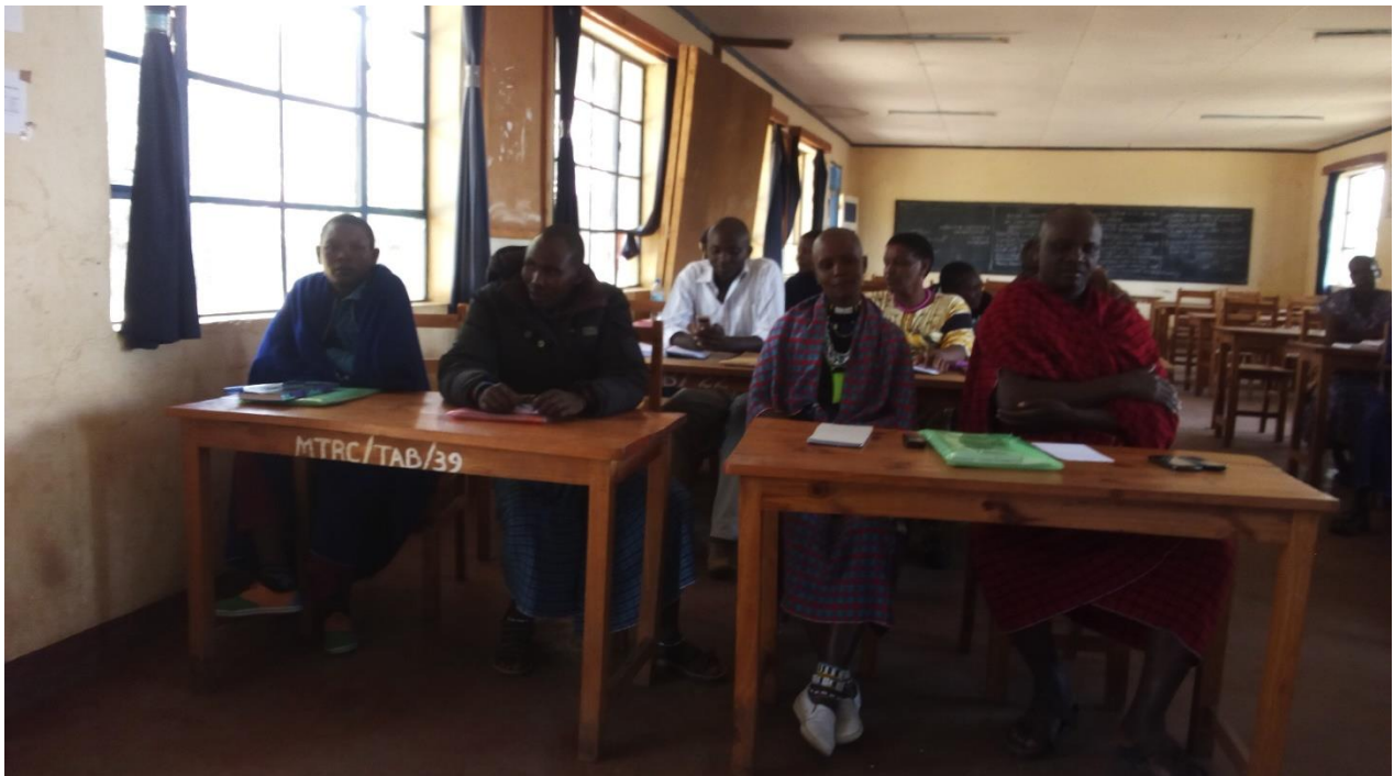
KAMATI TARAFU YA KISONGO WAKIPITISHA MIRADI YAKITARAFU