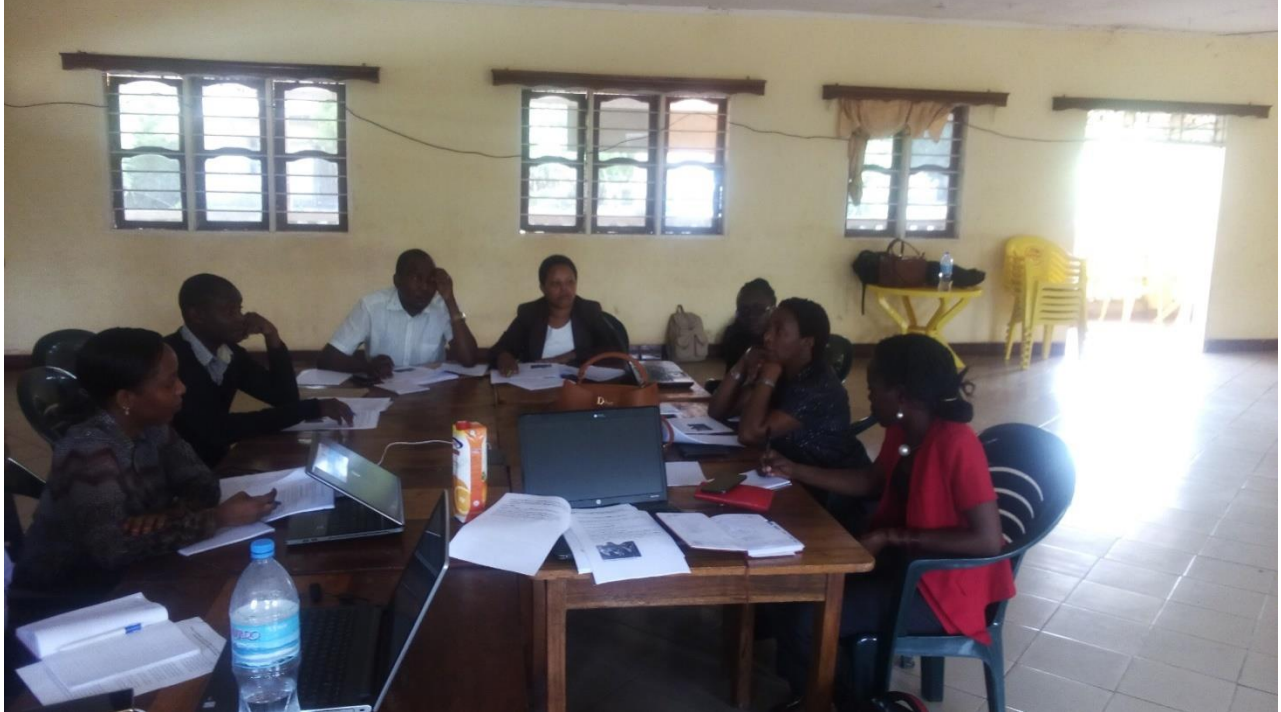
WATAALAM WA HALMASAHURI NA HAKI KAZI CATALYST WAKIFANYA MREJESHO WA MAFUNZO MTO WA MBU.